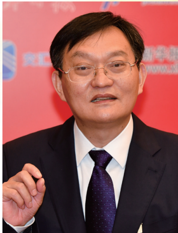
管圣达,全国人大代表,江苏综艺集团董事长。

开拓创新、敢于担当,旗下企业高质量发展,芯片产业化运用进展显著;生物制药高端人才集聚,领先科研成果不断。面对新冠疫情,捐赠350多万元加护灵空间除菌产品,支援湖北等地抗“疫”;加快“疫”后复工复产,出手收购枝江酒业,助推湖北困难企业“疫”后发展。积极履行代表职责,经常深入基层考察调研,广泛听取普通百姓和经济界人士意见,综合汇总分析。提出了《关于打通民企融资政策落地“最后一公里”的建议》《关于进一步活跃资本市场,拉动消费促进投资的建议》《关于加强防疫教育,优化健康环境的建议》等7条建议,引起国家相关部门重视。提出的关于“年份酒”的建议,新华社、《经济日报》、《证券时报》和人民网等中央媒体先后报道,推动“年份酒”乱象整治。