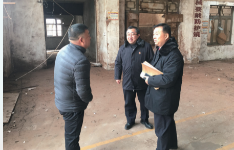
如皋院办理全省首起 “执转破”监督案件

依法办理民事监督案件702件,充分释法说理,促成息诉罢访。深化虚假诉讼监督,梳理“套路贷”、企业破产等案件监督线索,提出抗诉和再审检察建议49件,法院已采纳39件。开展民事执行和审判活动专项监督,如皋市院办理了全省首起“执转破”监督案件,建议将资不抵债的华星公司系列执行案移送破产审查,最大限度挽回债权人和企业职工的损失。