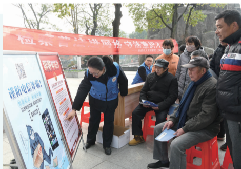
检察官进网格 开展普法宣传

与市网格办等三部门联合下发“网格+检格”行动方案,全市769名检察干警进网格1874人次,收集群众诉求、监督线索143个,协调解决问题246个。针对公共卫生、小区安防等管理漏洞,发出检察建议75份。如皋市院跟踪关注电瓶车充电安全隐患,促成135个小区清理楼道杂物210吨、增设充电位3540个。