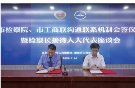
市检察院与市工商联 会签协作机制

联合市工商联出台工作意见,开展检察长“进园区、进项目、进企业”行动。开通“企业直通车”微信平台,成立“企明星”法治宣讲团,走进企业、商会开展防控法律风险宣讲26场。依法严惩侵犯企业合法权益犯罪,批捕起诉288人。秉持少捕少押慎诉司法理念,开展办案影响评估,对涉案民企经营管理人员依法不捕不诉120人。启东市院办理的一起串通投标案,对被出赁资质的11家公司和24名参与者作不诉处理,得到最高检、省委主要领导肯定表扬。