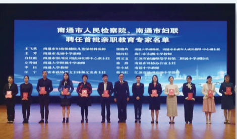
市检察院、市妇联聘任 首批亲职教育专家

对侵害未成年人的违法犯罪“零容忍”,批捕85人,起诉180人。持续落实最高检“一号检察建议”,法治副校长覆盖全市1049所学校,受教育师生6万余人次。完善罪错分级矫治干预机制,开展帮教挽救1529人次。联合教育、民政、团委、妇联等九部门落实强制报告制度,共同解决侵害未成年人案件发现难、报告难、追责难的问题。