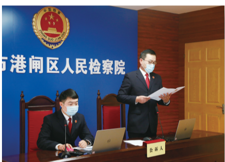
检察官远程出庭 公诉口置诈骗案

出台疫情防控“12条意见”和办案指引,起诉涉疫犯罪54人。协同法院、看守所、法援中心,实现全国首次涉疫案件远程庭审,央视网络频道等媒体同步直播,观看人次达1400万。全市300余名干警下沉社区和高速卡口为人民群众守护安全屏障。