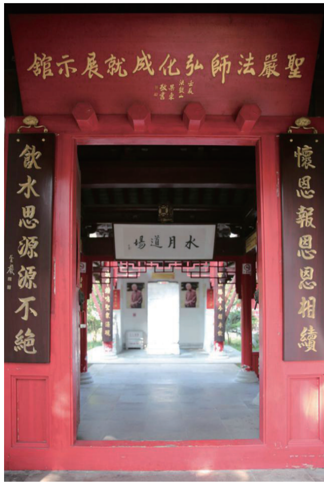
位于南通狼山的“圣严法师弘化成就展示馆”