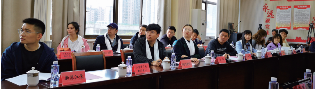
中央省市媒体集中采访南通教育。图为在南通西藏民族中学采访点了解情况。