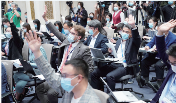
发布会现场

第七次全国人口普查主要数据结果11日发布。10年来,我国人口有哪些变化?“全面两孩”政策给力吗?老龄化进程加快了吗?我们一起从数据中找答案。