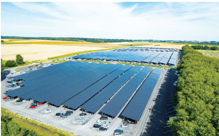
这是11日在比利时布吕莱特拍摄的天堂动物园光伏停车场。用光伏电池板做成的停车场棚顶能为80%以上的车位遮风避雨,电池板提供的电力可以满足动物园的用电需求,多余电力可为电动汽车充电,并回馈至公共电网。

种过疫苗的个体中传播率接近。 世卫组织统计显示,目前已有142个国家和地区报告了德尔塔毒株感染病例。 在全球疫情数据方面,周报显示,截至8月5日的一周内,全球累计新冠确诊病例超过2亿例,从1亿例到2亿例用时仅6个月。这一周全球新增确诊病例426万例,新增死亡病例6.5万例,两项数据均较前一周期有上升。 这一周新增确诊病例数居全球前五位的国家是美国、印度、伊朗、巴西和印度尼西亚。