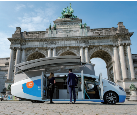
这是9月20日在比利时布鲁塞尔五十周年纪念公园拍摄的Stella Vita太阳能房车。该车在晴朗天气情况下最高可实现730千米的续航。

多方专家预计,鉴于德尔塔毒株导致的疫情反弹在美国尚未得到有效控制,死亡人数还将继续上升。