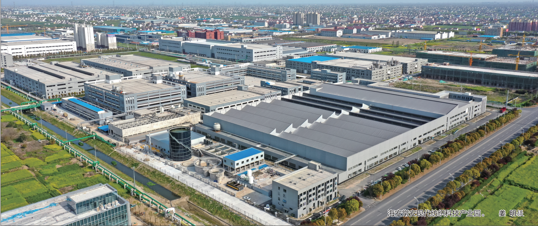
海安常安现代纺织科技产业园。