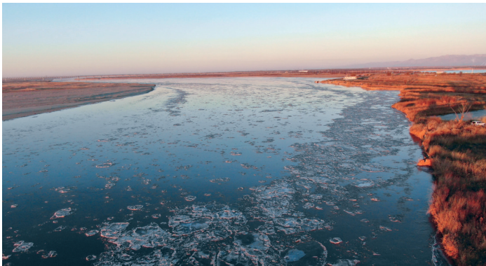
这是昨日拍摄的黄河宁夏河段流凌。随着黄河出现流凌,我国北方河流全面进入凌汛期。

《通知》要求,各有关部门、各地区要强化责任担当,勇于开拓创新,帮助中小企业应对困难,推动中小企业向“专精特新”方向发展。各有关部门要加强调研和指导支持力度,扎实推动各项政策措施落地见效。