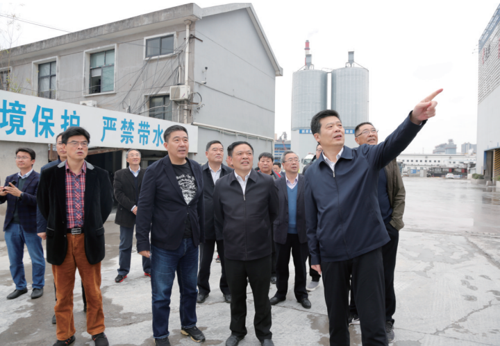
区政协开展老旧小区改造工作民主监督活动。

创新基地的提案,优化国土空间规划、对高新技术企业奖励扶持政策、加强公共卫生事业建设等的意见和建议,以及“优化环境卫生管理精细化、长效化机制”课题研究成果,得到区委、区政府高度重视。突出经济社会发展重点领域问题参政议政。深入开展“民营科创企业服务年”活动,就“推进村级集体经济发展”“推动跨境电商做大做强”“防范化解金融风险”等课题深入协商议政,收到良好效果。紧扣群众关心的难点痛点加强民主监督。就“擦亮崇川基础教育品牌”“推进张謇研学基地建设”等议题深入调研,围绕“老旧小区改造”、疫情防控、长江禁捕等开展民主监督,构建政协有建议、党政有措施、工作有实效的履职闭环。