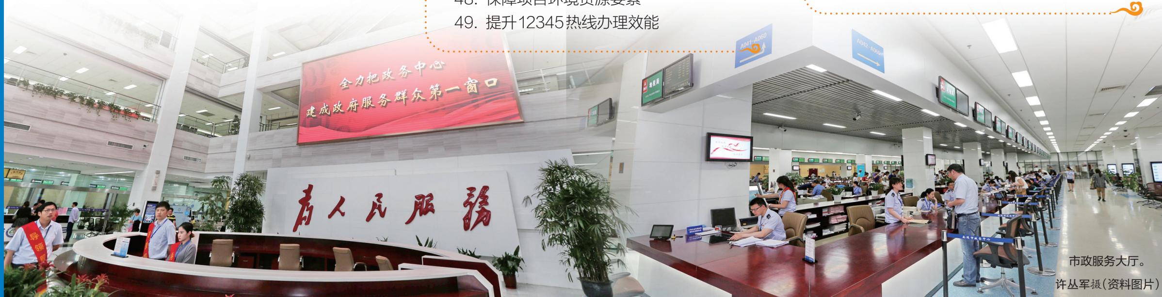
市政服务大厅。