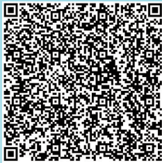
详细内容请扫描二维码

为全面落实《优化营商环境条例》和《江苏省优化营商环境条例》，以市场主体全生命周期需求为导向，构建“万事好通”南通营商环境品牌，对标先进，打造省内一流、国内领先的营商环境，结合南通实际，现提出“万事好通”南通营商环境优化提升举措66条。