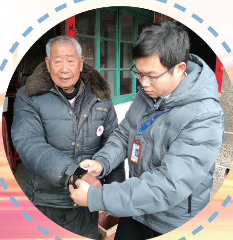
南通移动工作人员为“磨刀老人”戴上“智慧老年人手环”