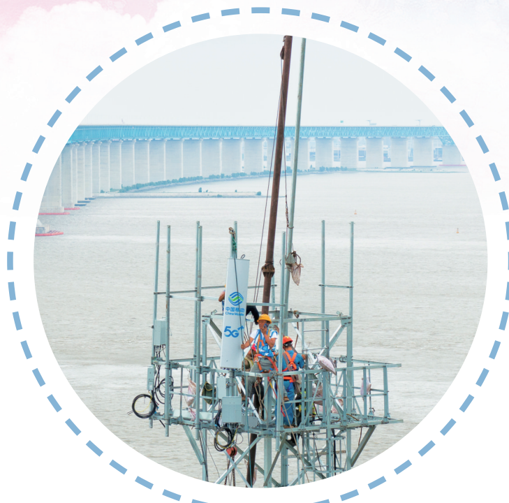
南通移动实施沪苏通长江公铁大桥5G网络覆盖

南通移动助力千行百业数字化转型,全年承建南通市应急管理指挥信息系统、开发区老旧小区监控改造、北城唐闸古镇建设、崇川公共部位智慧视图工程、海门图书馆、公安涉诈URL监测拦截平台等一大批具备战略意义的政府重大信息化项目45个,全方位为南通高质量发展蓄力续航。