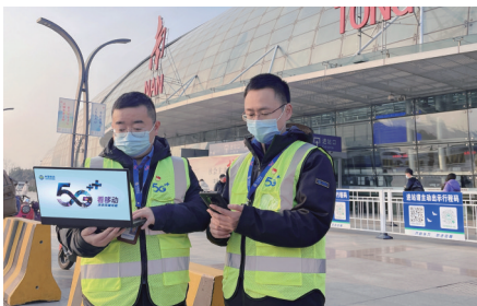
南通移动技术人员在火车站开展通信网络保障

结合南通地域特点,南通移动创新与海上风电企业深度合作,推进沿海及中近海海域5G网络深度覆盖。作为南通宽带“第一运营商”,南通移动深入推进“全千兆”服务,全市所有小区100%实现千兆接入,具备覆盖超过300万户家