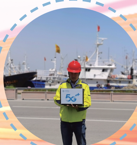
南通移动技术专家在洋口港调测5G网络信号