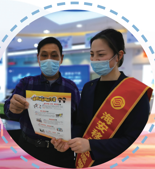
南通移动营业厅开展反诈宣传