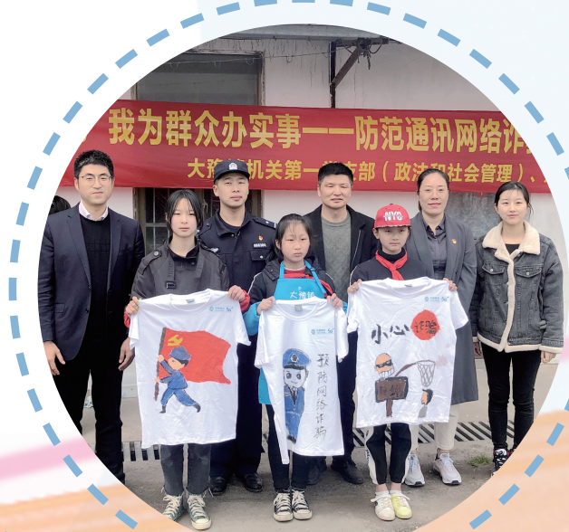
南通移动志愿者开展“反诈宣传”进校园活动

南通移动加强算力基础设施建设,建成华东地区大型IDC数据中心,获评中国移动钻石五星数据中心,机柜数超6000个,出口带宽超4000G,有效支撑全市互联网业务托管需求。新增海门万国、开发区亚细通IDC两座大型合作数据中心,总规模达3万机柜,基本完成环上海热点区域的合作数据中心布局。全面部署云资源池,服务企业3100家,全面护航南通高质量转型发展。