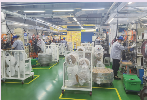
恒力(南通)产业园生产现场

今年以来,新冠疫情出现反复。通州区严格实行疫情防控措施,确保各园区平安,促进企业发展。4月7日起,南通大部分地区开始实行