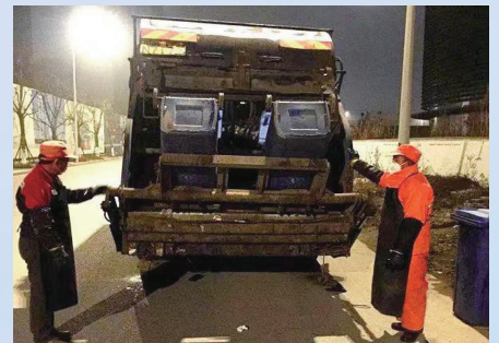
确保生活垃圾日产日清

除了现场服务以外,企业人事和求职人员也会通过电话,咨询例如“如何注册会员”“密码忘记了怎么找回”“如何参加招聘会”等问题,工作人员们都会热情耐心地进行解答,做好所有求职就业服务工作。1月至今,通州人力资源网新增注册求职者1001人,注册简历近300份,注册企业67家。