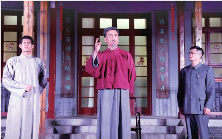
昨晚，南通博物苑内再现当年包含张謇在内的中国科学社大咖云集的场景。“南通博物苑奇妙夜”活动当晚举行，观众通过线上线下沉浸式游园，体验南通优秀传统文化。

的养老服务人员，在职称评定、职务晋升、等级认定等方面进行倾斜，适当提高工资、补贴等福利待遇；保障养老机构必要物资供给，加强对养老服务企业日常生活必需品的供应，保证所需粮油、肉蛋奶和新鲜蔬菜不脱档、不断供，保障养老机构日常运转；提供养老机构网上备案服务，对申请备案的养老机构，可通过电子邮件等方式提出申请、上传材料，通过部门信息共享核实有关信息，足不出户完成备案工作，实行“不见面备案”。