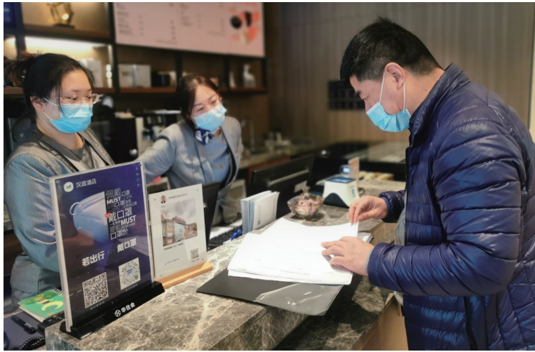
崇川区城东街道纪工委深入酒店等场所开展监督检查。