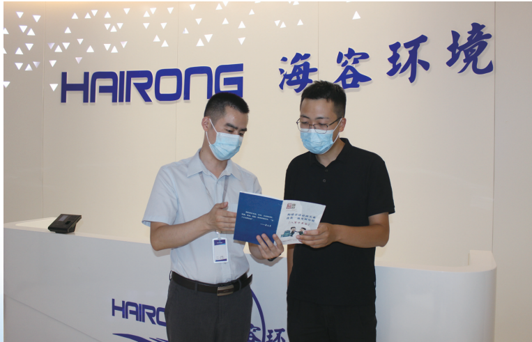
市北高新区纪工委走进企业宣传《漫说廉政——“八可十不为”》。