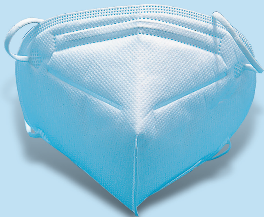
第一招 出门戴口罩