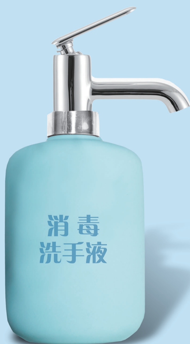
第四招 回家要洗手