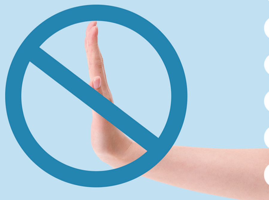
第三招 切莫乱触碰