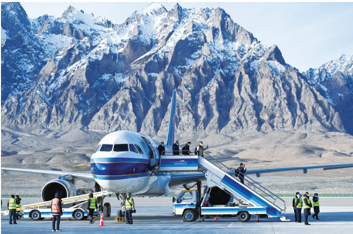
昨日,在喀什库干红其拉甫机场,乘坐首航航班的旅客走下飞机。当天,巍巍帕米尔高原上,中国最西端的运输机场——新疆喀什库干红其拉甫机场正式通航,冰山上迎来首批“空中来客”。

据新华社北京12月23日电 国家医保局近日印发《关于全面排查并取消医保不合理限制的通知》,将重点排查医保在协议管理、预算管理、审核结算、考核评价、基金监管等方面是否存在不合理限制和要求,直接或间接导致医疗机构在为参保人员提供医疗服务过程中,产生不方便甚至损害参保人员利益的行为。 国家医保局有关负责人介绍,根据群众反映以及前期调研情况,此次排查重点聚焦群众最为关心的三大类问题:一是住院医疗服务方面,是否存在医保对定点医疗机构年度总额预算/总额控制不科学、不规范且缺乏合理调整机制,以及是否存在对患者住院天数作出具体限制,导致推诿病人、分解住院等情况;二是门诊医疗服务方面,是否存在医保对参保患者用药规定具体天数或金额上限,导致医疗机构不能或便于开具长期处方;三是医保考核管理精细化方面,是否存在医保直接搬用有关部门管理指标作为医保部门管理指标,如住院、门诊次均费用、药占比等,导致医疗机构及参保人员误认为是医保部门的管理规定。 按照通知,2022年12月底前,统筹地区医保部门开展自查自纠,形成问题清单,根据具体情况逐一落实整改措施;2023年1月31日前,省级医保部门汇总全省情况,形成全省排查和取消医保不合理限制的整改情况报告。