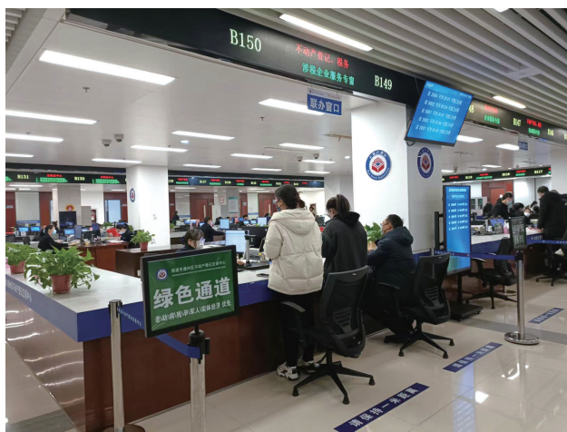
通州开设涉税企业服务专窗