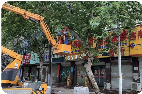
养护因台风受损树木

美丽景色不只在公园中,在通城主干道上,美丽的变化也在悄然发生。如今,市民行驶在工农路与城山路等主干道上,一路美女樱、千鸟花、翠芦莉、西洋滨菊、松果菊、大花萱草、柳叶绣线菊等花枝丰饶的花境十分惹人注目。我市城市绿化建设更加注重景观色彩的变化,突出“一路一景”,赏花树种、彩叶树种、花境的应用已越来越普遍,品种也日趋丰富。南通根据气候、地域等自然环境,选择合适的绿化树种,充分使用乡土树种,通宁大道的乌桕、跃龙南路的榉树、工农路的银杏、园林路的法桐、崇川路的樱花、啬园路紫薇、陈桥路的无患子,丰富的彩叶树种打造了各具特色的景观廊道,营造多彩季相景观,每个季节都能观赏到不同的色彩美景。