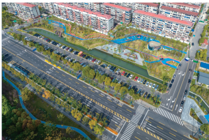
虹桥路两侧景观带