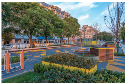
瑞星花园南侧绿地

“现在我们接送小孩方便多了,不用一直站着等候,还有座椅可以休息,有绿色植物养养眼。”在紫琅一小南侧绿地,色彩明亮活泼的休憩健身设施映入眼帘,这是紫琅公司新建改造的一处少儿友好型街道游园。