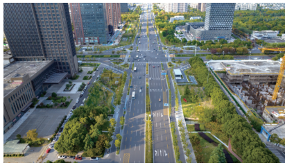
工农路两侧绿化景观带

近年来,市政园林部门着力构建与地铁时代相适应的慢行系统,在濠河景区提升、市区重点道路停车秩序整治、人民路改造等综合整治工程中大力推进步道提升,有效协调城市道路、街道界面及滨水绿道资源,多措并举沟通步道断点,绿化改造拓宽人行道空间,机非分离保障慢行车辆路权,构建漫步、跑步、骑行三重慢行交通体系,实现交通与公共服务功能有机融合,在提升市民绿色出行体验的同时,打造出彰显历史文化、可供休闲娱乐的公共生活空间。