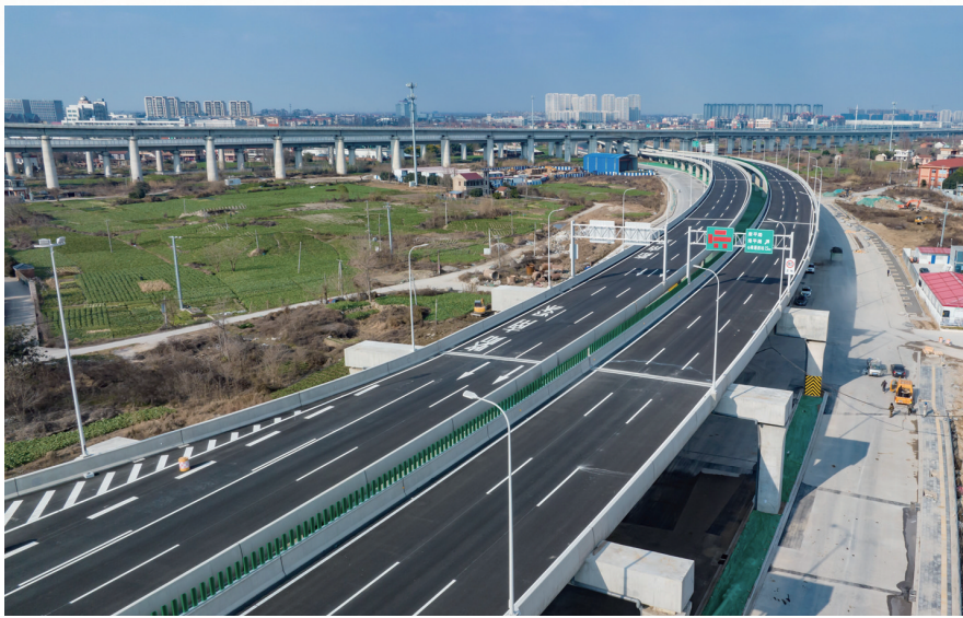
西站大道二期高架通车

高架如虹,巨龙腾飞。2022年12月28日,历时12个月、347天施工建设,西站大道二期迎来历史时刻——西站大道二期高架正式通车。西站大道二期是促进南通中心城区一体化、推动产城融合发展的重要抓手,也是加强城市基础设施建设、提升综合交通枢纽功能的样板工程,更是社会各界热切期盼的民生工程,通车使中心城区与南通西站实现了20分钟内快速通达,有力推动中心城区与平潮更好融合发展。