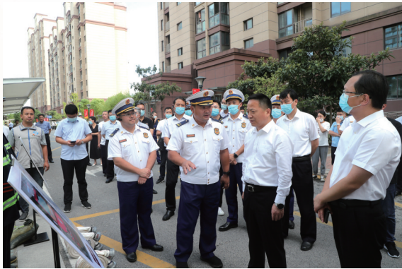
基层消防领域三清

这一年,共解决子女入学入园37人次,3人享受中考加分,向32名指战员发放爱心救助金,办理核发家属随队未就业安置补偿金33.2万元,组织10批次151人次疗养,13名消防员学历得到提升,77人次完成驾驶员培训,45人取得AOPA无人机飞行执照,指战员归属感、荣誉感明显提升。全市政府专职消防救援队完成立项15个,开工17个,投入执勤24个,队伍规模位居全省第二。坚持统一招录、统一培训和统一管理,实现“人员提档、素质升级、水平更新、能力换代”。2022年内,280名新队员分配到基层一线,158名文员完成纪律作风轮训。