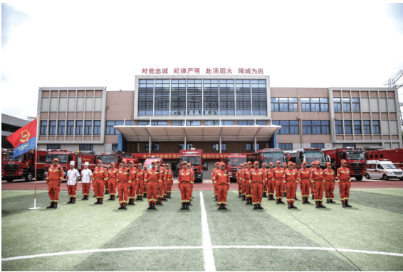
全省战勤力量拉动