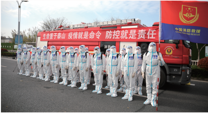
防疫消杀 使命在肩

新起点,新征程!市消防救援支队党委将时刻铭记领袖训词,毫不动摇地坚持抓班子带队伍、抓党建促队建,始终以永不懈怠的精神状态、一往无前的奋斗姿态、人民至上的奉献心态,只争朝夕、不负韶华,奋力开创南通消防工作和队伍建设新局面,为南通构建长三角一体化发展重要支点、打造全省高质量发展重要增长极创造良好的消防安全环境!