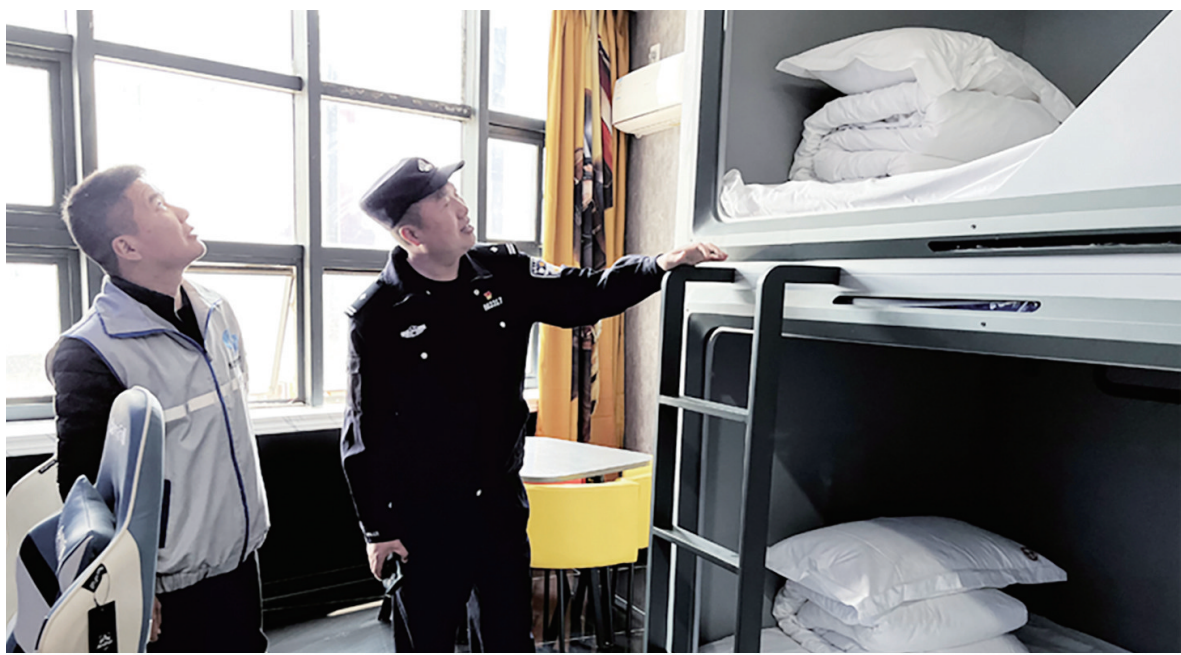
▲秦灶街道民安花苑社区联合社区民警、网格员到辖区宾馆开展联合检查。