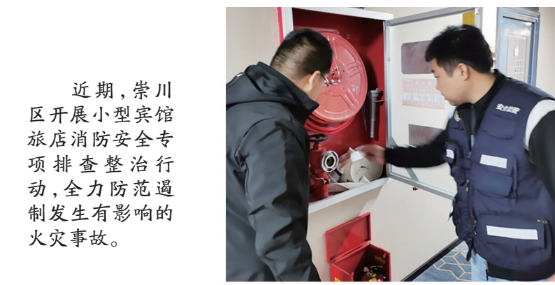
▲崇川经济开发区洪济社区对茉莉花酒店、电竞酒店、澄园酒店进行消防检查。