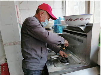
“穆邻”志愿者上门服务。