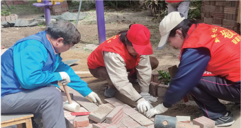
菊馨社志愿者们开展服务。