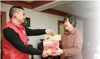
郭里头村社区慰问劳模。