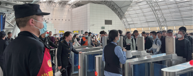
南通站派出所民警、铁路职工、志愿者坚守岗位。