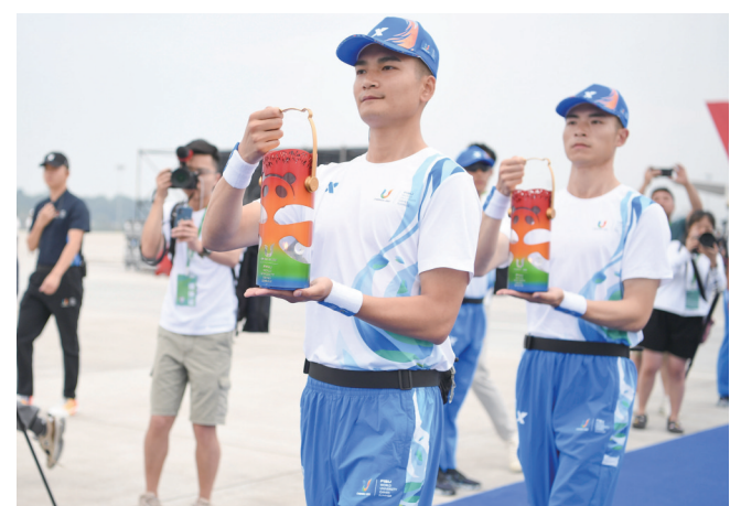
8日,在成都天府国际机场,护卫队队员护送第31届世界大学生夏季运动会的火炬准备登机。接下来,火炬将在北京、哈尔滨、深圳、重庆、宜宾五座城市传递。

据海军招飞办有关负责人介绍,今年参加实装筛选飞行的招飞对象全部为按照本科一批录取的普通高等学校理学、工学专业应届毕业生,其中包括若干名女生。在通航培训机构完成航空理论、地面准备、模拟飞行的学习考核后,他们再进行15小时约80架次起降训练,包括起飞和着陆、平飞和上升下滑、水平转弯和盘旋、俯冲和跃升等飞行内容。