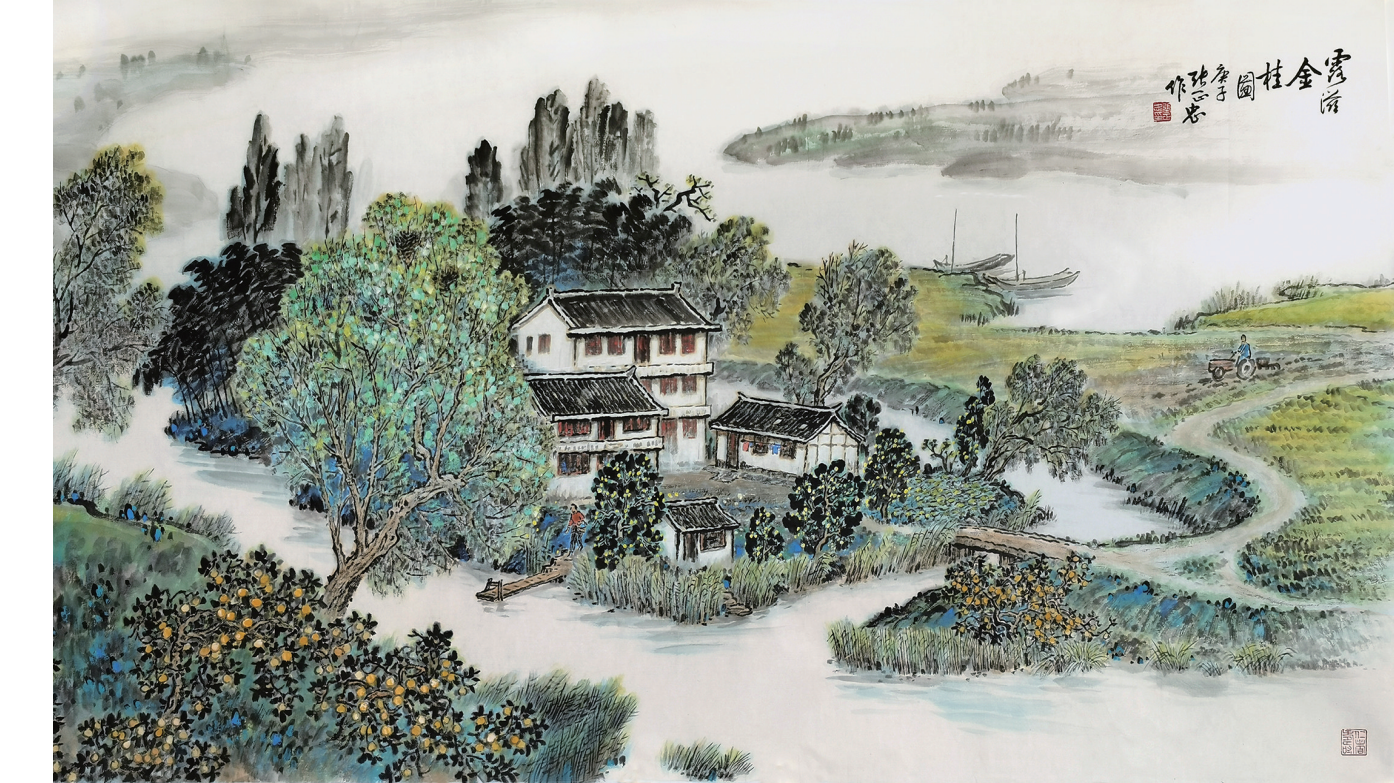
露滋金桂图 张正忠绘

录用联在濠河景点的悬挂，提升了景区的文化品位，形成了一道靓丽的风景线。（南通市楹联学会供稿）