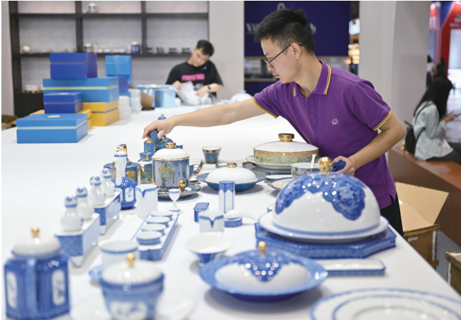
昨日,参展商在海南国际会展中心布展。第四届中国国际消费品博览会将于4月13日在海南省开幕。

报告预测,按市场汇率计算,全球实际国内生产总值(GDP)将在两年内保持稳定增长,2024年预计增长2.6%,2025年预计增长2.7%。