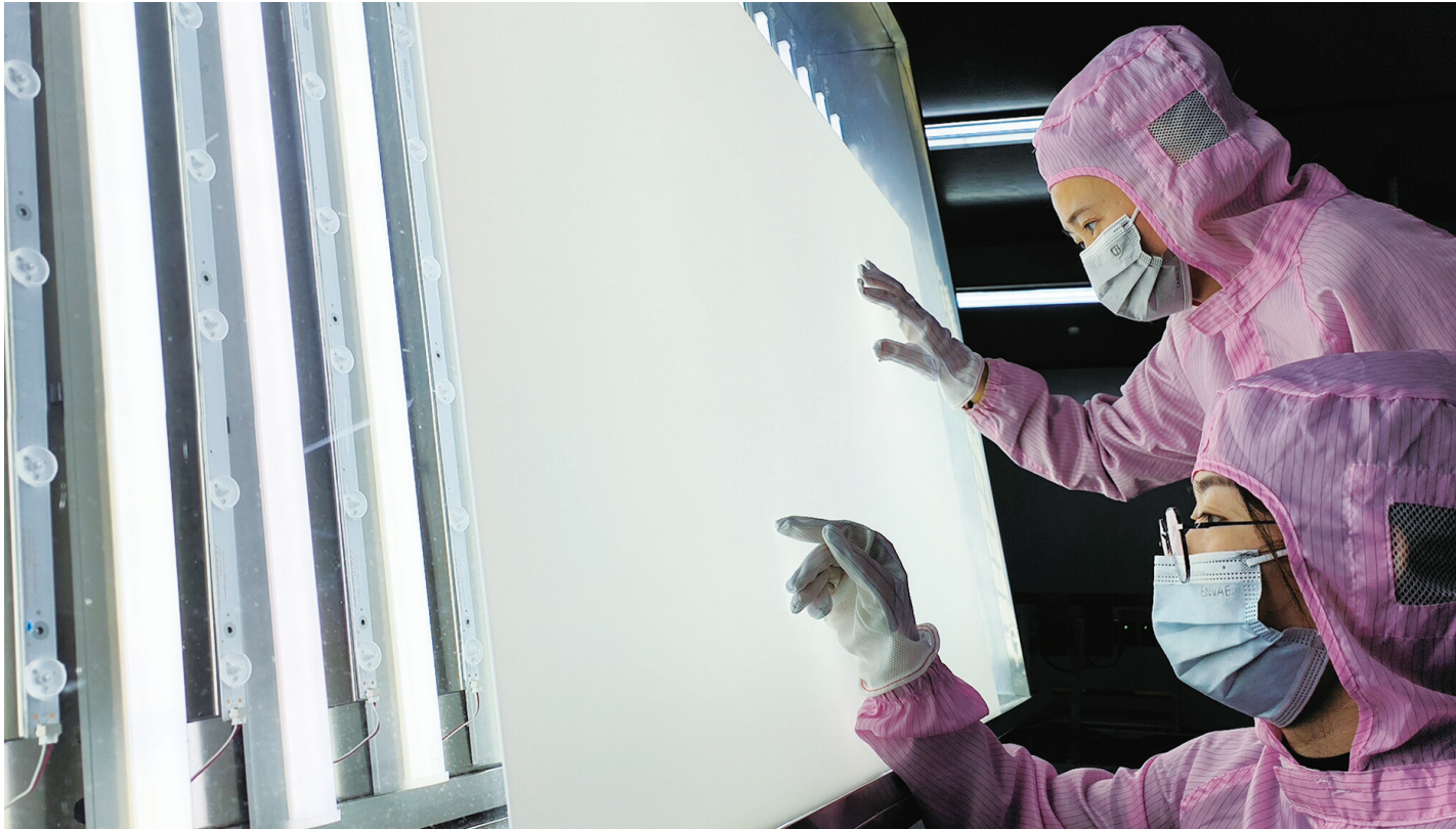
创亿达新材料生产车间。

新质生产力离不开创新,江苏如通石油机械股份有限公司是如东经济开发区(高新区)首家本土上市公司,去年产销全年忙,今年订单更多、全员更忙。“我们走高端化研发,让产品装上更强的大脑,成为海内外外商的抢手货。”公司董事长曹彩虹道出订单爆满的秘籍,“把技术骨干派驻到油田,既当服务员,也当需求采集员,每年把10多个新产品推向市场,育出发展的先机,今年外销比例提升到4成。”