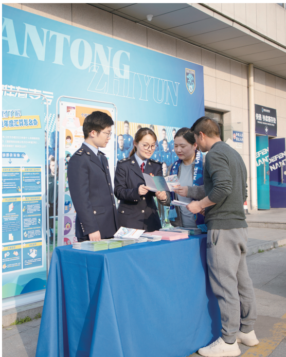
税务干部现场讲解税费优惠政策。