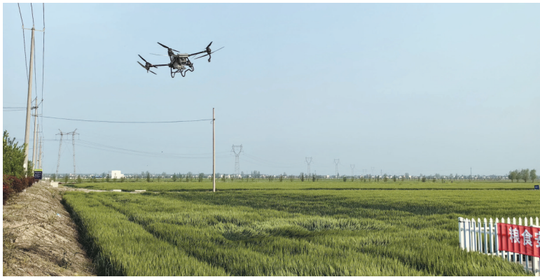
通州区金沙街道开展小麦赤霉病防治工作。

目前,全市小麦赤霉病防治工作正在有序进行。截至4月19日,全市小麦扬花面积241.97万亩,累计防治面积260.12万亩次,其中统防统治面积186.85万亩次,占防治面积71.83%。