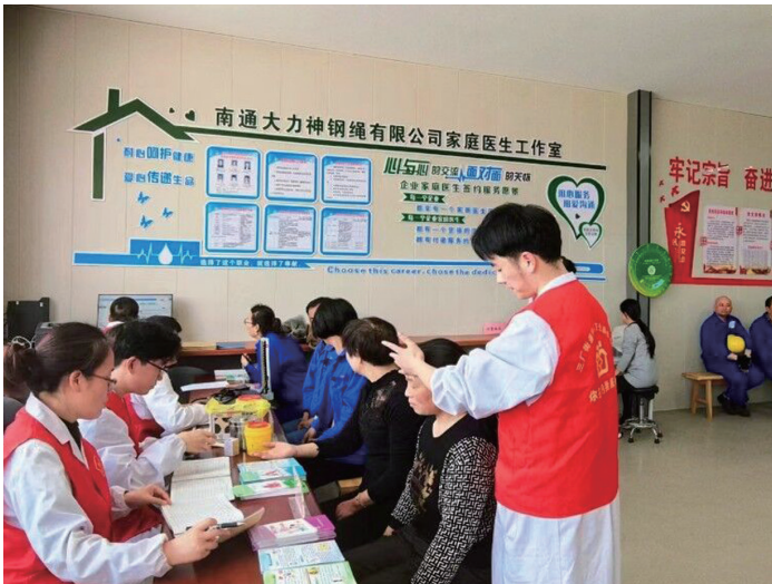
大力神钢绳公司家庭医生工作室,医生为职工推拿按摩。