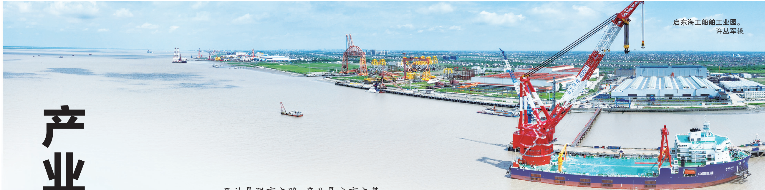
启东海工船舶工业园。

开放是强市之路,产业是立市之基。 1984年5月,中共中央、国务院决定进一步开放上海、广州等14个沿海港口城市。作为首批沿海开放城市之一的南通,自此掀开了产业发展的崭新篇章。 从改革开放初期成为中国工业明星城市崭露头角,到抢抓多重战略机遇奋力打造中国现代工业名城,四十年风雨兼程,南通立足资源优势、机遇优势、发展优势,全面推进经济结构调整,凭借深厚的工业基因,瞄准中高端苦练内功,奋力打造先进产业集群,筑牢制造业高质量发展根基,在经济长河的关键节点上赢得先发优势。 2023年,南通名列全国制造业高质量发展50强城市的第12位,全市工业用电、工业开票销售、规上工业增加值增幅均位居全省前列,工业经济对GDP增长贡献度超50%。 以产业为基,因产业而兴。南通以四十年奋斗交出精彩答卷,历经从无到有、从小到大的艰难与辉煌,持续推进工业化进程,在开放中实践,在实践中创新,立足实体经济行稳致远,聚力产业强市进而有为。