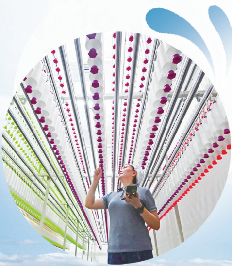
大生智慧纺纱工厂。 丁传彬摄