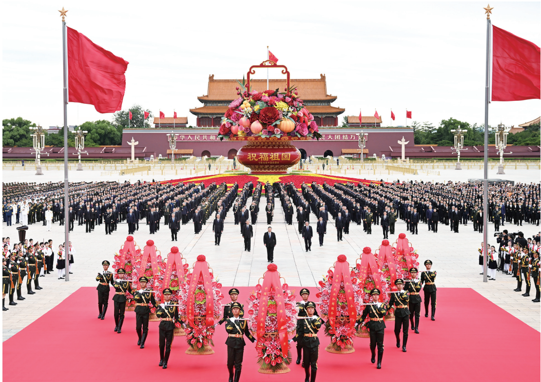
习近平等党和国家领导人出席烈士纪念日向人民英雄敬献花篮仪式。