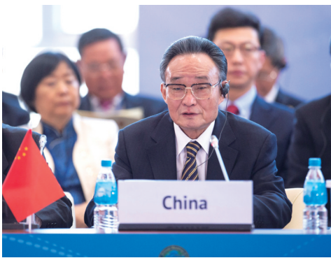
▲2013年1月28日,吴邦国同志在俄罗斯符拉迪沃斯托克出席亚太会议论坛第21届年会,并作题为《坚持和平发展 促进合作共赢》的主旨发言。