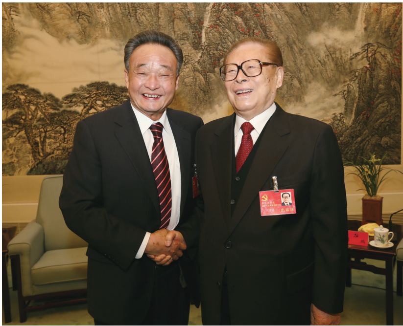
▲2012年11月14日,中国共产党第十八次全国代表大会在北京闭幕。这是闭幕会前,江泽民同志与吴邦国同志在一起。