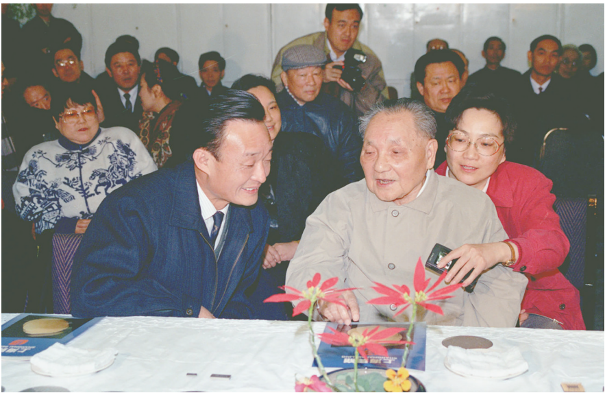
▲1992年2月10日,邓小平同志在上海贝岭微电子有限公司参观时与吴邦国同志交谈。