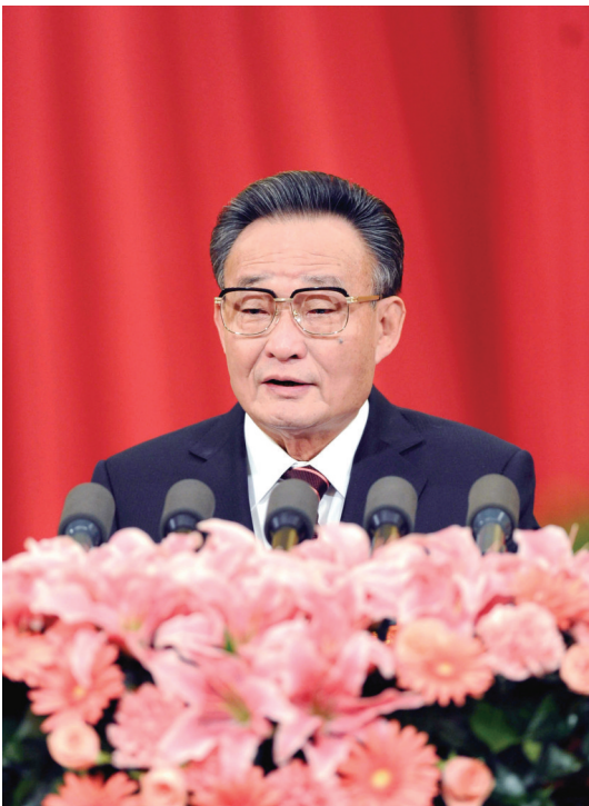
▲二〇一一年三月十日,十一届全国人大四次会议在北京人民大会堂举行第三次全体会议。吴邦国同志作全国人民代表大会常务委