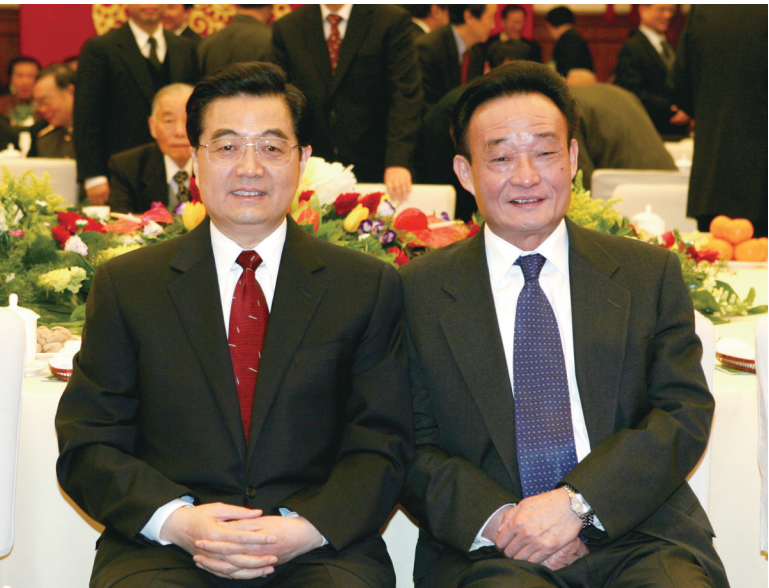
▲二〇〇五年一月一日,全国政协在北京举行新年茶话会。这是胡锦涛同志与吴邦国同志在一起。