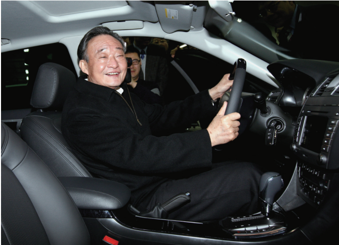
▲2010年1月30日,吴邦国同志在上海汽车集团股份有限公司技术中心察看新能源样车。