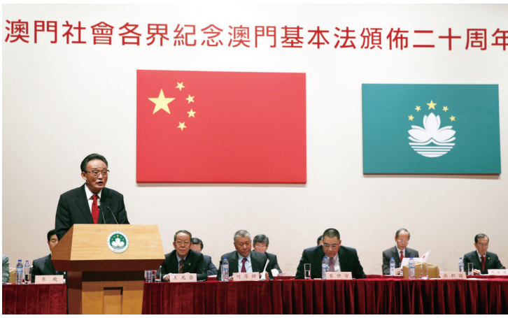
▲2013年2月21日,吴邦国同志在澳门文化中心出席澳门社会各界纪念澳门基本法颁布20周年启动大会并发表讲话。