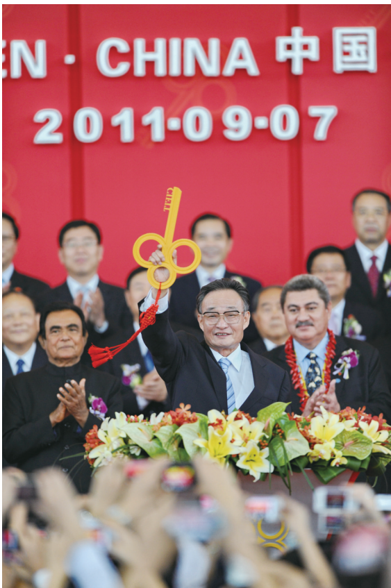
▲2011年9月7日,吴邦国同志在福建厦门出席第十五届中国国际投资贸易洽谈会开幕式。