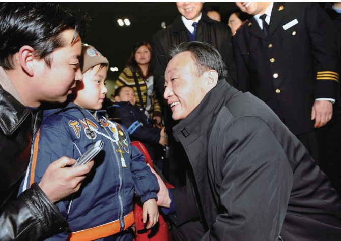
▲2008年2月3日,吴邦国同志在北京西站候车室与旅客交谈。