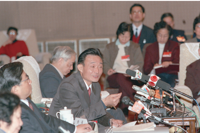
▲1994年3月,时任上海市委书记的吴邦国同志在全国两会上海代表团全团会议上。