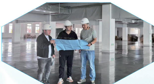
服务可为科技一期项目