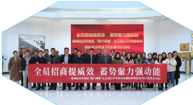
举办“三招三引”专题培训