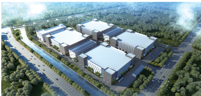
新帝克“年产16万吨高性能聚合物单丝项目”效果图

“在我们印象中，从拿地到开工要两三个月，但这次24小时实现了‘拿地即开工’，为企业大大降低了成本。”今年7月，总投资12亿元的新帝克年产16万吨高性能聚合物单丝项目正式开工，项目负责人感动地说道。