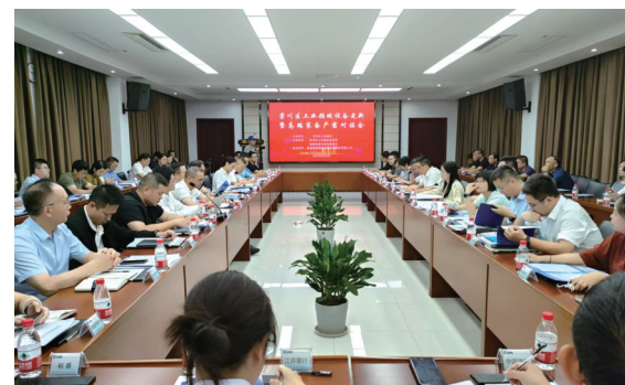
举办工业领域设备更新暨高端设备产需对接会

企业遇到了问题怎么办？港闸经济开发区规模以上企业都会第一时间想到联系他们的“首席服务员”。最近，“首席服务员”又帮企业解决了一件“燃眉之急”。