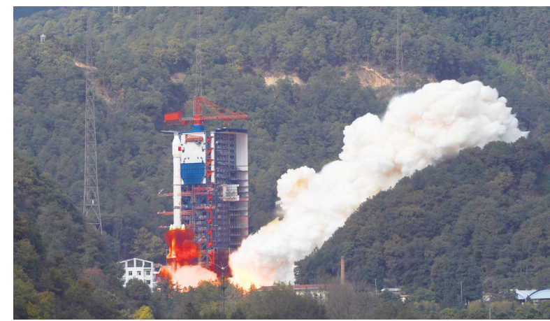
3日13时56分,我国在西昌卫星发射中心使用长征三号乙运载火箭,成功将通信技术试验卫星十三号发射升空,卫星顺利进入预定轨道,发射任务获得圆满成功。

要通过广泛的学习宣传阐释工作,引导广大党员、干部、群众进一步学懂弄通做实习近平新时代中国特色社会主义思想,深入学习贯彻习近平文化思想,更加深刻领悟“两个确立”的决定性意义,增强“四个意识”、坚定“四个自信”、做到“两个维护”,自觉在思想上政治上行动上同以习近平同志为核心的党中央保持高度一致,锐意进取、守正创新,埋头苦干、勇毅前行,奋力开创宣传思想文化工作新局面,为以中国式现代化全面推进强国建设、民族复兴伟业而努力奋斗。